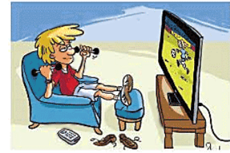
Dessin Dawid - (dr)

La sédentarité crée les conditions par lesquelles tout effort physique devient plus désagréable et pénible. Cette sensation a un effet dissuasif qui tend à réduire, encore plus, le niveau physique du sédentaire.